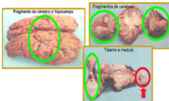
Figura 01 - Partes anatômicas para o diagnóstico da raiva em herbívoros